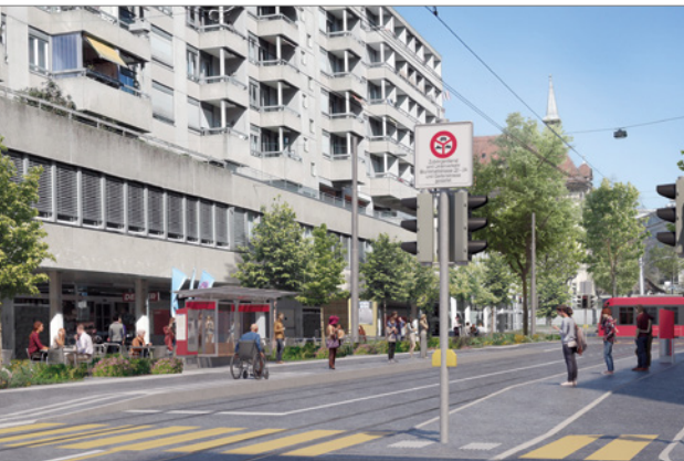
Die Visualisierung zeigt den neu gestalteten «Quartierplatz Brunnhof». Der Platz wird für den Durchgangsverkehr gesperrt und die Fahrbahnfläche reduziert. Zehn neue Bäume werden gepflanzt.

Für mehr Sicherheit sorgt die neue Platzierung der beiden Tramhaltestellen Munzinger: Heute steigen die Fahrgäste mitten im Strassenraum