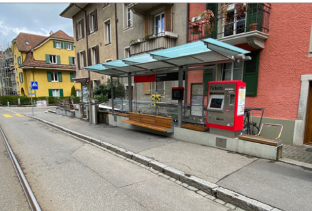
Alle Tramhaltestellen auf der Linie 6 ab der Effingerstrasse sind noch nicht hindernisfrei ausgestaltet. Das Bild zeigt die Haltestelle Cäcilienstrasse. Hier ist die Haltekante zu niedrig und zu weit von den Gleisen entfernt.

An den Sanierungsarbeiten sind verschiedene Partnerinnen und Partner beteiligt, wobei sämtliche Massnahmen in einem Gesamtprojekt gebündelt sind. Ein Gesamtprojekt ist im Vergleich zur etappierten Ausführung der einzelnen Sanierungsmassnahmen kostengünstiger. Beteiligt am Projekt sind Bernmobil, Energie Wasser Bern, der Kanton Bern als Eigentümer der Weissensteinstrasse und die Stadt Bern, welche die Projektleitung innehat.