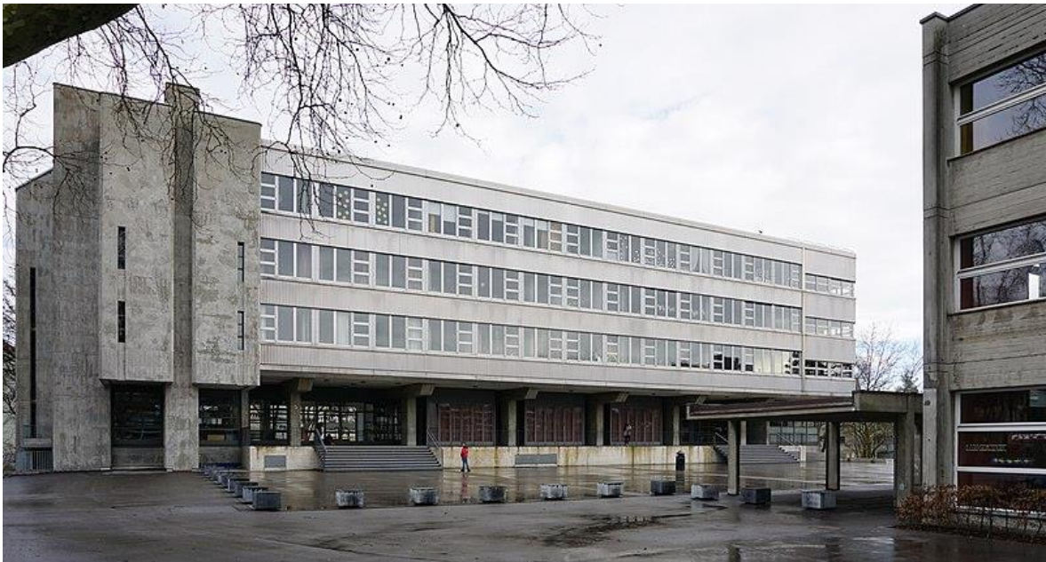
Südwestfassade der Fellerstrasse 18

Das Terminprogramm sieht die Planungsphase der Gesamtanierung ab März 2024 vor.