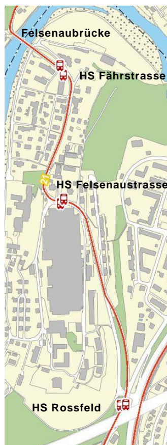
Abbildung 2: Rossfeld - Fahrstrasse