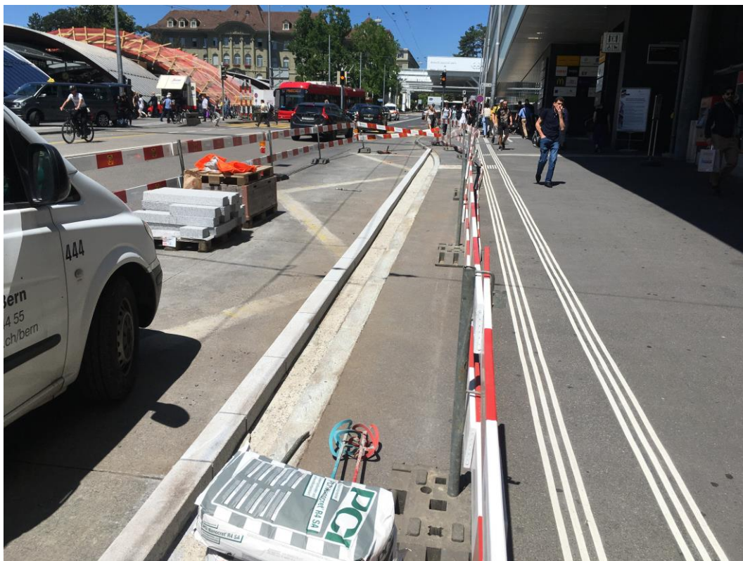
Provisorische Anpassung der Bushaltestelle Schanzenstrasse an die Erfordernisse der längeren Doppelgelenkbusse. Definitiv umgestaltet und den Vorgaben des BehiG angepasst wird die Haltestelle im Rahmen des Projekts ZBB.

Ursprünglich war geplant gewesen, alle fünf Haltestellen definitiv für längere Busse umzurüsten und sie gleichzeitig gemäss Behindertengleichstellungsgesetzgebung barrierefrei umzugestalten. Die Vorgabe lautet, dass Anlagen des öffentlichen Verkehrs bis 2023 so einzurichten sind, dass sie auch von Menschen mit Behinderungen autonom genutzt werden können. Zudem sollten im Rahmen der Anpassungsarbeiten auch die Werkleitungen im Umfeld der Haltestellen saniert werden. Dass diese Arbeiten nun nicht in einem Zug umgesetzt werden können, hat mit dem Projekt Viererfeld/Mittelfeld zu tun, dessen Perimeter sich in unmittelbarer Nähe der Buslinie, insbesondere der Haltestellen Innere Enge, Äussere Enge und Rossfeld befindet und das sowohl Auswirkungen auf die Anordnung der Haltestellen als auch auf die Bemessung der Werkleitungen haben könnte. Das ÖV-Erschliessungskonzept fürs neue Quartier liegt noch nicht vor; auch die Dimensionierung der Werkleitungen ist noch nicht abschliessend geklärt. Um eine Wertvernichtung zu vermeiden, sollen deshalb die Haltestellen Innere Enge, Äussere Enge und Rossfeld (stadtauswärts) nur provisorisch umgestaltet und im Rahmen des vorliegenden Projekts einzig den Erfordernissen der Gelenkbusse angepasst werden – wie dies unlängst auch an der Bushaltestelle Schanzenstrasse (Linie 20) gemacht worden ist (vgl. nachfolgendes Bild).