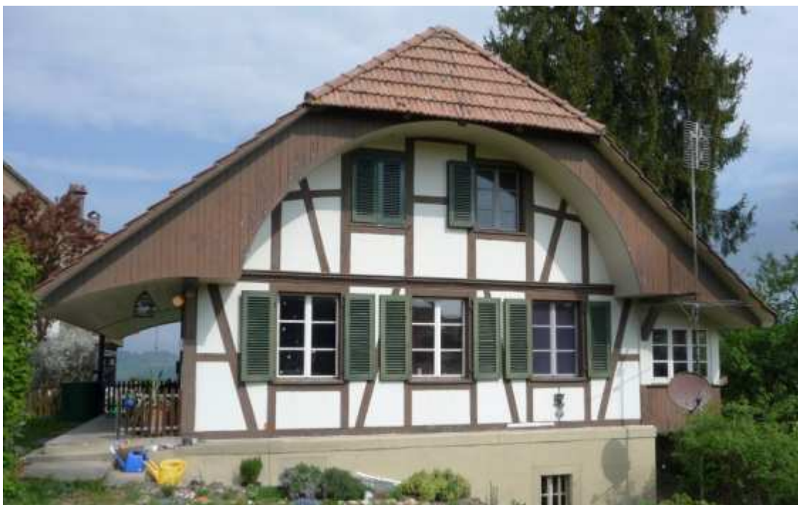
Stöckli Hubelweg 9

Bei den Liegenschaften handelt es sich um drittvermietete Wohnhäuser, welche keinen unmittelbaren öffentlichen Zweck erfüllen. Aus diesem Grund ist das Grundstück mit den beiden Gebäuden ins Finanzvermögen zu entwiden und anschliessend dem Fonds zuzuweisen. Die künftige Bewirtschaftung wird weiterhin von Immobilien Stadt Bern (Immobilienmanagement des Fonds) wahrgenommen.