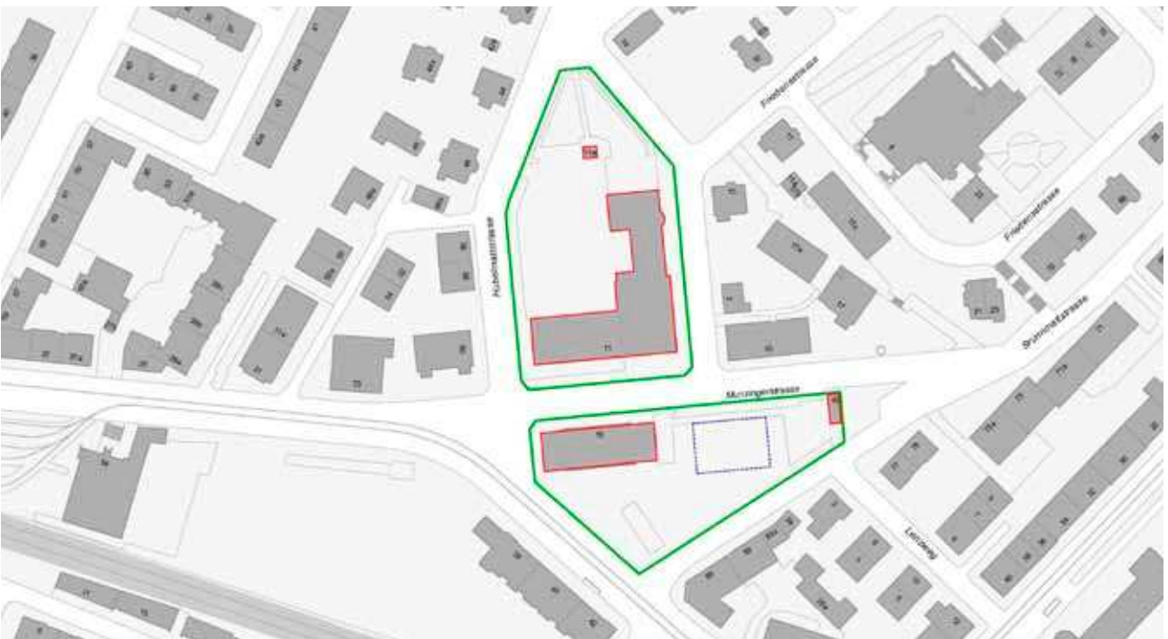
Zur Schule VS Munzinger gehörende Gebäude (rot) auf der Parzelle (grün), möglicher Standort Modulbau (blau)