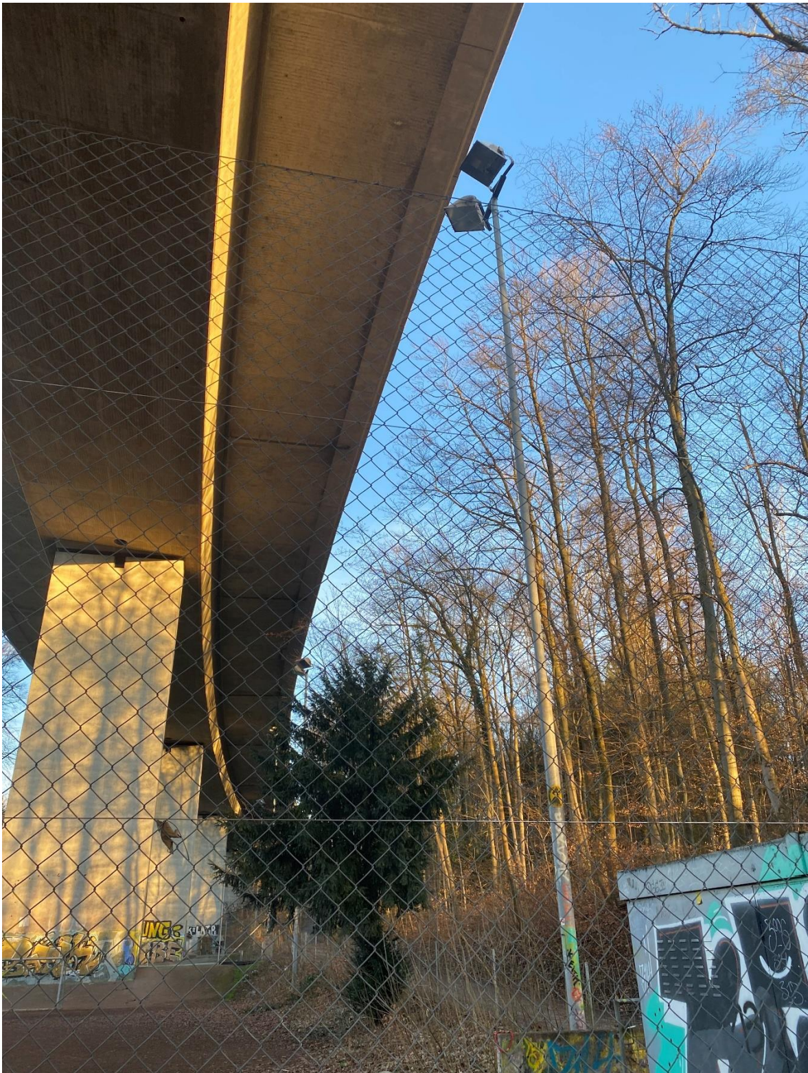
Bestandsplatzbeleuchtung und Situation Platz in Waldnähe, rechts unten das Bestands-WC

Aus ökologischen Gründen wurde wieder ein Kunstrasenspielfeld «Typ unverfüllt» geplant. Diese Wahl entspricht dem städtischen Konzept, wonach für neue Anlagen oder bei Ersatz von bestehenden Feldern möglichst ein unverfüllter Kunstrasen oder ein Kunstrasen mit einer ökologisch vertretbaren Verfüllung gewählt werden soll.