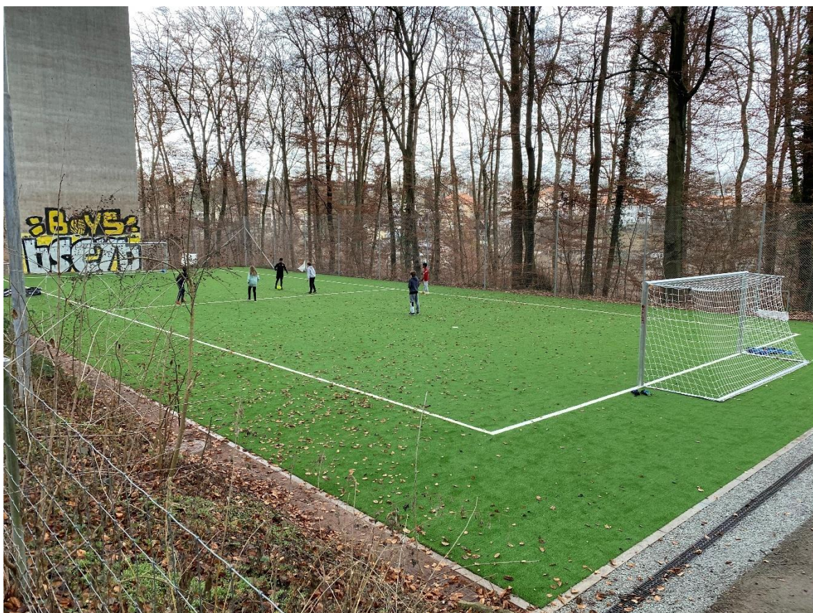
Foto des im Jahr 2021 umgewandelten 1. Kunstrasenspielfeld