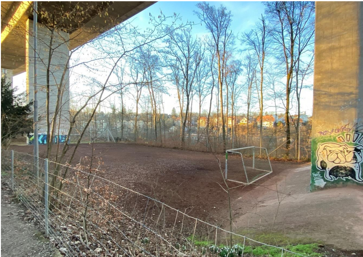
Heute bestehender Allwetter-Hartplatz unter dem Autobahnviadukt

Die heutige Spielfeldgrösse von ca. 43m x 21m wird beibehalten und maximal ausgenutzt. Das vorhandene Zugangstor und die Platzzufahrt sollen auf drei Meter verbreitert werden, um die Zufahrt der Maschine für die Pflege und weiterer Unterhaltsgeräte zu ermöglichen. Der bestehende Ballfangzaun wird instandgesetzt und nur wo notwendig erneuert. Die vorhandene Platzbeleuchtung wird ebenfalls instandgesetzt. Es ist zudem eine Umrüstung auf LED geplant. Die südliche Böschung des Platzes soll mit einheimischen Waldstauden bepflanzt werden, um den heute offenen Erdboden zu schliessen und somit die Böschung vor Erosion zu schützen, den Sandeintrag auf das Spielfeld zu minimieren und ungewünschten Bewuchs zu verhindern. Die Planung des neuen Platzes ist auf ein Minimum an Unterhaltsaufwand ausgelegt.