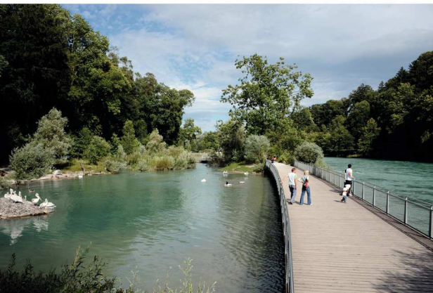
Wertvolles Nacherholungsgebiet mitten in der Stadt Bern: Aareuferanlage im Tierpark Dählhölzli.

1900 vermachte William Gabus der Stadt Bern 150'000 Franken für die Errichtung eines Tierparks. Sein Legat wurde nach seinem Tod 1901 im Gabus-Fonds angelegt und wertvermehrt. 1935 stimmten die Bernerinnen und Berner der Schaffung des Tierparks Dählhölzli zu. Finanziert wurde er zu über 50 Prozent aus den Mitteln des Gabus-Fonds. Dieser Fonds wird seit 1901 von der Direktion für Finanzen, Personal und Informatik (FPI) geführt. Hier werden alle Legate, Spenden und Donationen gesammelt. Die Mittel stehen ausschliesslich für den Tierpark zur Verfügung. Sie wurden beispielsweise bei der Realisierung der Papageitaucher-Halle und des Bären-Waldes eingesetzt.