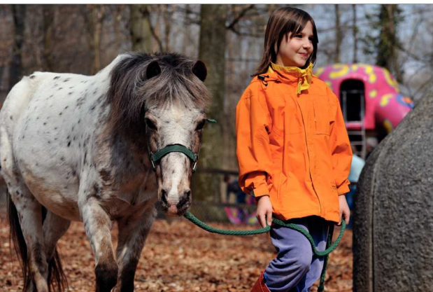
Der Tierpark ermöglicht hautnahe Kontakte mit Tieren: Mädchen beim Ponyführen.

Die Grundlagen für die Neuorganisation werden in einem eigenen Reglement (dem Tierparkreglement) geregelt.