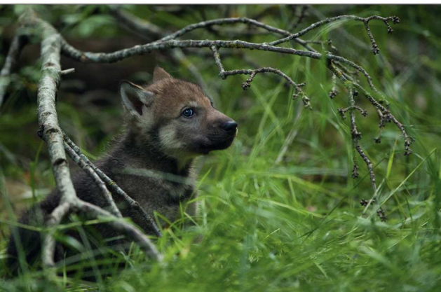
Jungtiere im Tierpark Dählhölzli: Nachwuchs in der neuen Wolfsanlage.

Der Gemeinderat entscheidet über die Zuweisung von Grundstücken und Anlagen des Verwaltungsvermögens. Er legt zudem die Höhe der Eintrittspreise fest. Frei zugänglich sind der BärenPark, die Anlagen am Aareufer und die öffentlichen Wege innerhalb der Tierparks.