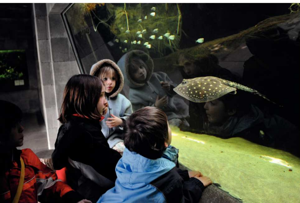
Der Tierpark vermittelt Wissen um die Tierwelt: Kinder beim Beobachten eines Stechrochens im Aquarium.

Die neue Organisation hat keine Konsequenzen für die Mitarbeiterinnen und Mitarbeiter des Tierparks. Sie werden weiterhin dem städtischen Recht unterstellt bleiben.