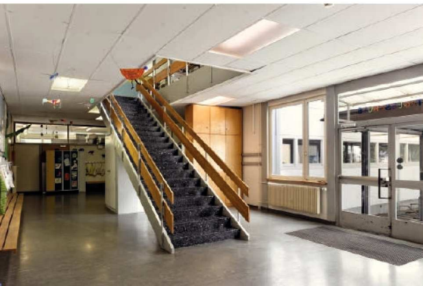
Das Schulgebäude am Winterfeldweg 15 wurde vor rund 50 Jahren erstellt. Es wurde noch nie saniert und weist mittlerweile erhebliche bauliche und betriebliche Mängel auf (im Bild ist der Eingangsbereich zu sehen).

1967 wurde die bestehende Schulanlage mit einem Provisorium am Winterfeldweg 15 ergänzt. Dieses Gebäude wurde als kurzfristige Schulraumerweiterung für die Volksschule Stapfenacker erstellt und ist denkmalpflegerisch nicht von Bedeutung. Das Provisorium wurde noch nie saniert und weist nach fünfzig Jahren nicht nur betriebliche, sondern auch erhebliche bauliche Mängel auf. Die Tragstruktur des Gebäudes besteht aus einem Raster aus Stahlstützen und Stahlträgern. Die Innen- und Aussenwände sind mit Leichtbauplatten oder Kalksandstein ausgefüllt. Bedingt durch diese einfache Bauweise ist der Energieverbrauch des Gebäudes entsprechend hoch und erfüllt in keiner Weise die heutigen Standards. Eine 2014 durchgeführte Schadstoffuntersuchung förderte zudem Asbestprodukte sowie Polychlorierte Biphenyle (PCB) zutage (siehe Fachbegriffe Seite 4). Die nötigen Sofortmassnahmen wurden getroffen. Bei einer Sanierung, aber auch bei einem Rückbau müssen diese Schadstoffe sorgfältig demontiert und entsorgt werden. Nicht zuletzt entspricht das Gebäude auch nicht mehr den heutigen Anforderungen und Vorschriften an die Hindernisfreiheit und den Brandschutz.