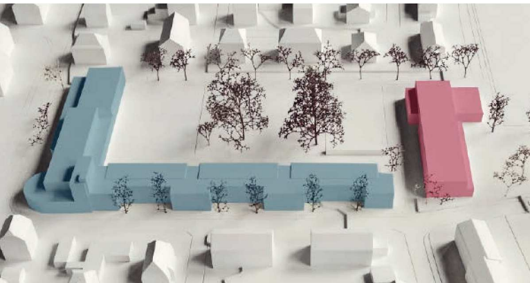
Die Volksschule Stapfenacker im Modell. Der Ersatzneubau an der Winterfeldstrasse (rot markiert) ergänzt die bestehende Schulanlage an der Brünnenstrasse 40 (blau markiert) optimal.

Analog zum Altbau sind auch beim Ersatzneubau die Räume im Untergeschoss durch Lichthöfe mit Tageslicht versorgt. Das neue Gebäude ist als Massivbau aus Stahlbeton konzipiert. Die Tragstruktur ist nach aussen mit einer Wärmedämmung umhüllt. Die Glasfronten werden mit einer Fensterkonstruktion aus Holz und Metall mit Isolierverglasung ausgeführt. Im Innenraum wird der intensiven Beanspruchung Rechnung getragen, indem einfache und zweckmässige Materialien verwendet werden. Eine sorgfältige