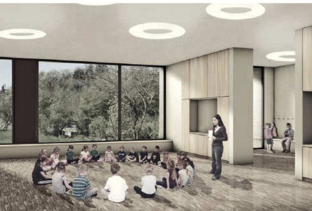
So wird der Ersatzneubau im Innern aussehen: Visualisierungsbild mit den künftigen Unterrichtsräumen.

Die für die Realisierung des Ersatzneubaus nötige Anpassung der Nutzungsplanung – die Verschiebung der Baulinie und die Änderung der Zonenvorschrift – wurde bereits beschlossen und vom kantonalen Amt für Gemeinden und Raumordnung genehmigt.