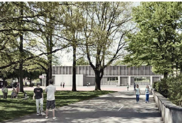
So wird der Ersatzneubau aussehen: Visualisierungsbild des künftigen Innenhofs mit der Fassade Nordost.

Die heute wenig genutzte Aussenfläche mit dem ehemaligen Schulgarten westlich des Sportplatzes wird umgestaltet und aufgewertet. Sie dient künftig den drei Basisstufen im Erdgeschoss als geschützter Aussenraum. Der vorgesehene Fussweg verläuft zwischen dem Aussenraum der Basisstufe und dem nach Süden verlegten Biotop. Die restliche Aussenfläche der Anlage soll möglichst wenig verändert werden. Die im Erdgeschoss untergebrachte Tagesschule orientiert sich zum bestehenden Aussenraum im Innenhof der Schulanlage. Dieser wird in ein-