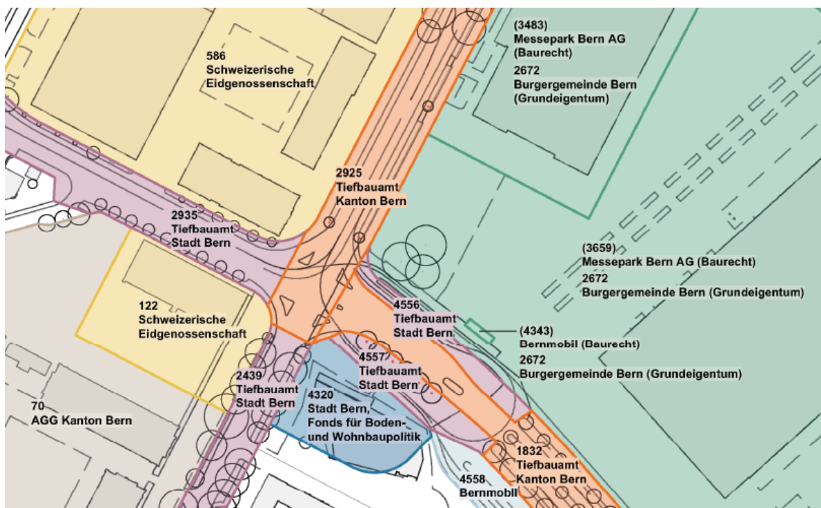
Abbildung 2: Übersicht Grundeigentümer*innen

BERNMOBIL übernimmt sämtliche Kosten, die im Zusammenhang mit dem Gleis- und Fahrleitungsbau stehen. Dazu gehören der Abbruch der bestehenden Gleise und deren Ersatz (inkl. neues Trasse) von der Rodtmattstrasse in die Papiermühlestrasse sowie Anpassungen an den Fahrleitungen. Ebenfalls zulasten von BERNMOBIL gehen die Kosten im Zusammenhang mit der Stromversorgung für den Trambetrieb sowie für die betrieblich notwendigen Anlagen wie Billettautomaten und Informationstafeln bei den Haltestellen.