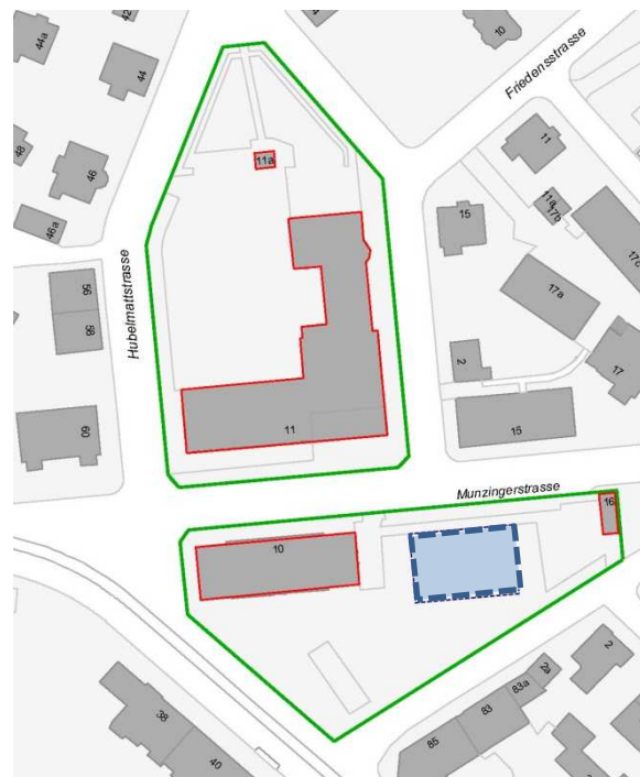
Geeigneter Standort für Modulbau (blau) auf Munzingerwiese

Um den Schulraumbedarf der Volksschule Pestalozzi kurzfristig zu decken, wird ein Modulbau mit sechs Klasseneinheiten benötigt. Der dreistöckige Modulbau soll auf der Munzingerwiese neben der heutigen Aula (ehemals Turnhalle) errichtet werden. Die Parzelle ist als Nutzungszone «Freifläche B» und somit als Zone für öffentliche Nutzung bezeichnet. Planungsrechtlich ist ein Bau in der benötigten Grössenordnung grundsätzlich bewilligungsfähig. Das Areal ist erschlossen und die Terrainverhältnisse verlangen keine aufwändigen Grabarbeiten. Die Nähe zum Schulhaus Munzinger schafft räumliche Synergien mit dem bestehenden Schulbetrieb.