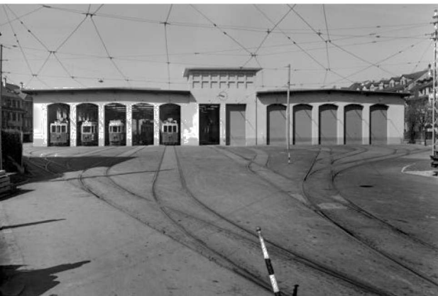
Das Tramdepot Burgernziel an der Thunstrasse 106 war während über 100 Jahren in Betrieb. Nun steht das Areal frei für die Schaffung von Wohnraum und Dienstleistungsangeboten.

Die Stadt wird das Areal weder selber bebauen noch verkaufen, sondern den gesamten Perimeter im Baurecht abgeben. Sie schätzt den Ertrag aus dem Baurechtszins auf über 500'000 Franken pro Jahr. Dies unter Berücksichtigung des gemeinnützigen Wohnbauanteils und reduzierter Ansätze für Geschäftsflächen zwecks Sicherstellung der Quartiernutzung. Die Stimmberechtigten befinden sich mit dieser Vorlage über die Abgabe des Geländes im Baurecht. Falls sie einer solchen zustimmen, wird das Gelände des Tramdepots Burgernziel ausgeschrieben. Nach heutigem Planungsstand kann frühestens im Frühjahr 2016 mit dem Baubeginn gerechnet werden. Es wird ein Drittel des künftigen Wohnraums auf dem Grundstück Tramdepot und auf den Grundstücken an der Staufferstrasse als gemeinnütziger Wohnraum genutzt werden. Die Grundstücke an der Staufferstrasse sind bereits heute im Baurecht an eine Baugenossenschaft mit gemeinnützigem Charakter abgegeben.