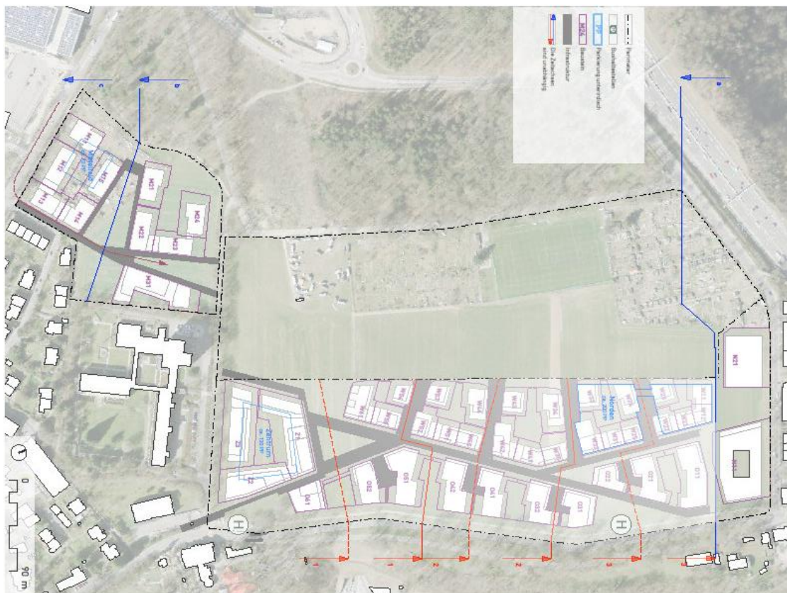
Abbildung 3: Elemente (Detailkorrekturen noch möglich) der Quartierentwicklung: Bausteine mit Innenhöfen (violett mit Bezeichnung), Erschliessungsanlagen (grau), Einstellhallen (blau), Etappierungsprinzip Viererfeld (rot), Etappierungsprinzip Mittelfeld (blau)

Der Masterplan berücksichtigt auch die geplante Volksschule mit Sportanlage am nördlichen Rand des Viererfelds. Das Projekt Volksschule mit Sportanlage ist damit Teil der Quartierentwicklung, bildet aber keinen Bestandteil dieser Vorlage. Ein entsprechender Kreditantrag zur Realisierung der Volksschule mit Sportanlage wird den Berner Stimmberechtigten zu einem späteren Zeitpunkt separat vorgelegt.