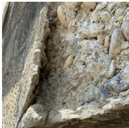
Schadhafte und lose Betonschale im Sturzbereich