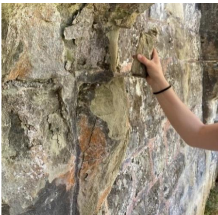
Durch Verwitterung loses Mauerwerk am Kamin