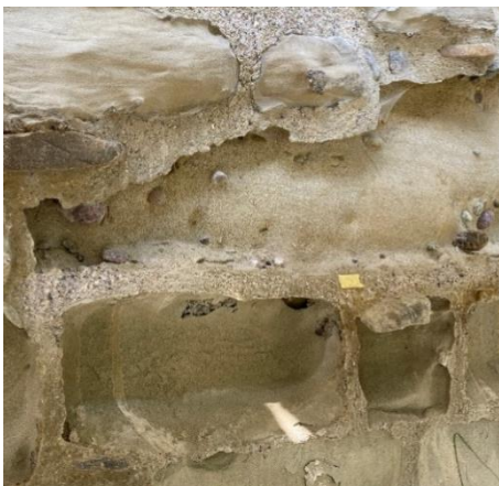
Starke Verwitterung des Sandsteins, die harten Betonfugen bleiben stehen.

Die Bauarbeiten waren in zwei Etappen geplant: Sanierung Hauptburg (Bauetappe 1) im Jahr 2022, Sanierung Vorburg (Bauetappe 2) im Jahr 2023. Im April 2022 begannen die Arbeiten mit dem Einrücken der Hauptburg sowie der Aufnahme des Ist-Zustands und der Analyse der vorhandenen Schäden an der Hauptburg durch die beauftragte Firma Wirz Restauratoren. Diese Analyse war notwendig, um die richtigen Sanierungsmassnahmen zu definieren und ein Unterhaltskonzept für die Zeit nach der Sanierung zu entwickeln. Die Mauern der Hauptburg wurden von der beauftragten Firma von April bis Juni 2022 in digitalen Schadenskartierungen dokumentiert. Im Zuge der Zustandsaufnahme und Schadensanalyse stellten die Fachleute fest, dass der Schadensumfang und die Schadenstiefe am Mauerwerk ein deutlich grösseres Ausmass aufwiesen als in der Planungsphase 2018 erkennbar und abschätzbar. Erst vom Gerüst aus und mit dem Blick von oben auf das Mauerwerk waren die Schäden in ihrem wahren Ausmass erkennbar, wie zum Beispiel die Schalenbildung, bei der sich von oben her Hohlräume und senkrechte Platten an den Sandsteinsteinen ausbilden, die herunterfallen, wenn sie weit genug verwittert sind.