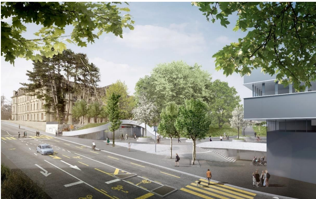
Visualisierung des neuen Bahnhofzugangs Länggasse. Die Velostation wird unter der Treppenanlage gebaut, der Zugang erfolgt im Bereich der Velofahrenden unten rechts im Bild (Abbildung: @ikonaut im Auftrag der SBB).

Die neue Velostation kommt unter der geplanten Treppenanlage südlich des neuen Bahnhofzugangs Länggasse zu liegen. Sie grenzt direkt an die bestehende Velostation Schanzenbrücke und soll mit dieser verbunden werden. Der Zugang zur neuen Velostation erfolgt über die Schanzenstrasse (siehe Visualisierung) und wird mit Schiebetüren und einem betreuten Empfang ausgerüstet. Weiter wird die Installation eines automatischen Zutrittskontroll- und Bezahlsystems sowie eines Informations- und Leitsystems geprüft. Die Zufahrtssituation von der Schanzenstrasse her wird mit der Umsetzung des Projekts städtische Verkehrsmassnahmen Zukunft Bahnhof Bern (ZBBS) verbessert.