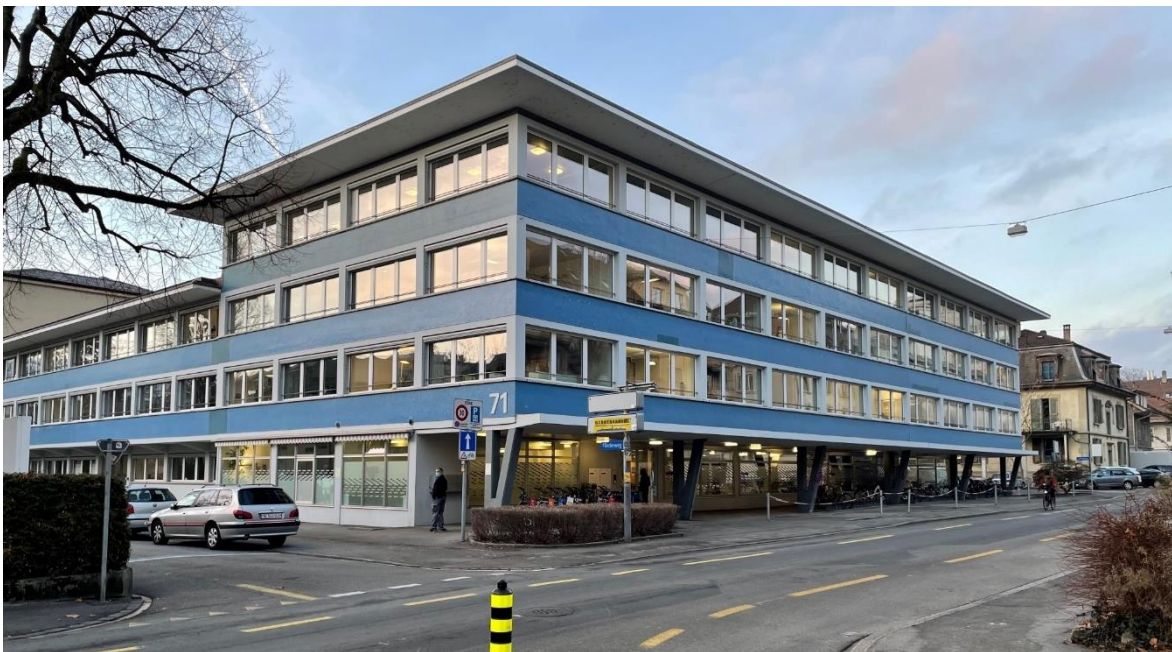
Das elegante Haus an der Schwarztorstrasse 71 verkörpert die verspielte Leichtigkeit der 1950er-Jahre.