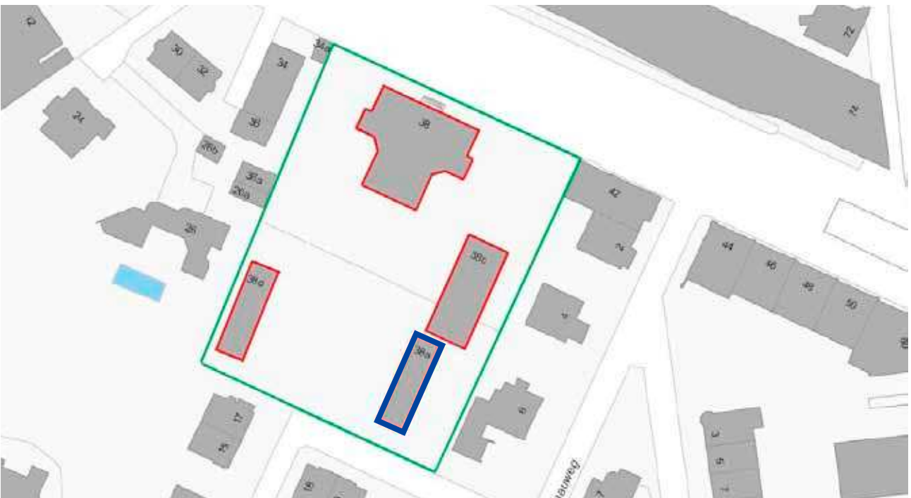
Zur Schule VS Sulgenbach gehörende Gebäude (rot) auf der Parzelle (grün), mit bestehendem Kindergartengebäude 38a (blau)