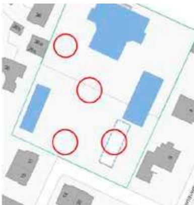
Mögliche Standorte für einen Neubau zur näheren Überprüfung

Der bald 70-jährige bestehende Kindergarten entspricht den Anforderungen für eine Basisstufe in betrieblicher, räumlicher wie auch pädagogischer Sicht nicht mehr. Im Weiteren ist der Gebäudezustand sanierungsbedürftig. Es scheint naheliegend, den bestehenden Doppelkindergarten abzubauen und an seiner Stelle einen Neubau zu errichten. Bei näherer Betrachtung zeigt sich, dass auch andere Standorte auf dem Schulareal für einen Neubau eignen. Die Standortevaluation ist die erste zu klärende Frage, mit welcher sich die beauftragten Planer derzeit auseinander setzen. Die Setzung des Neubaus muss mit der bestehenden Gebäudestruktur der Schulanlage übereinstimmen. Ebenso sind betriebliche Abläufe, pädagogische Anforderungen sowie die Aussenraumnutzung zu berücksichtigen. Eine enge Zusammenarbeit mit Schulamt, Bauinspektorat, Stadtplanungsamt und der Denkmalpflege ist unabdingbar. Um das neue Volumen zu optimieren, sollen Synergien zwischen den vorhandenen und den nach dem Richtprogramm für Schulen erforderlichen Räume definiert werden. Je nach Projekt können Räume wie: Windfang/Garderobe, WC-Anlagen, Technik-, Putz- und Materialraum sowie die notwendigen Aussenspielflächen gemeinsam genutzt werden oder in ihrem Flächenanspruch reduziert werden. Der Neubau wird gemäss den Vorgaben des Gemeinderates im Standard Minergie P-ECO geplant.