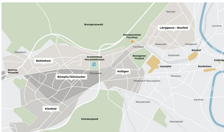
Abbildung 2: Ausbau des Fernwärmenetzes in den Quartieren (Stand Oktober 2022)

Im Januar 2020 haben die Bauarbeiten der Transportleitung von der Energiezentrale Forsthaus ausgehend nach Westen begonnen, im Oktober 2022 konnte das erste Gebäude mit Fernwärme versorgt werden. Der Ausbau des Fernwärmenetzes dauert nach heutigem Wissenstand bis ins Jahr 2035 und umfasst am Ende insgesamt 36 Kilometer Hauptleitungen.