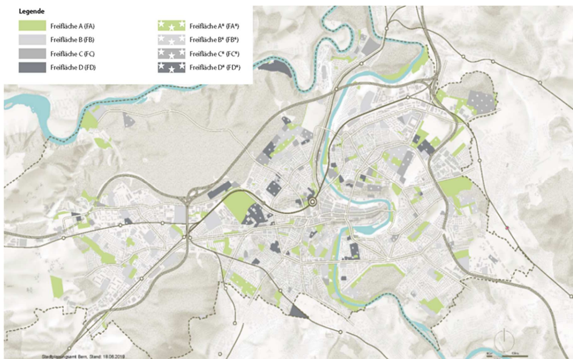
Übersicht: Zonen im öffentlichen Interesse / Freiflächen

In der Stadt Bern sind heute 355 Zonen für öffentliche Nutzungen FA bis FD und Zonen für private Bauten und Anlagen im öffentlichen Interesse FA* bis FD* ausgeschieden. Die 740 von der Teilrevision betroffenen Parzellen können in 168 zusammenhängende Areale zusammengefasst werden (siehe Anhang 1).