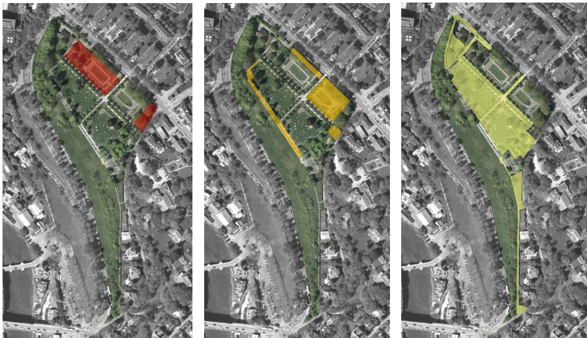
Abb. 1: Hervorhebung der unterschiedlichen Eingriffsbereiche