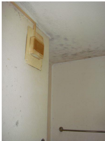
Wasserschäden im Bad