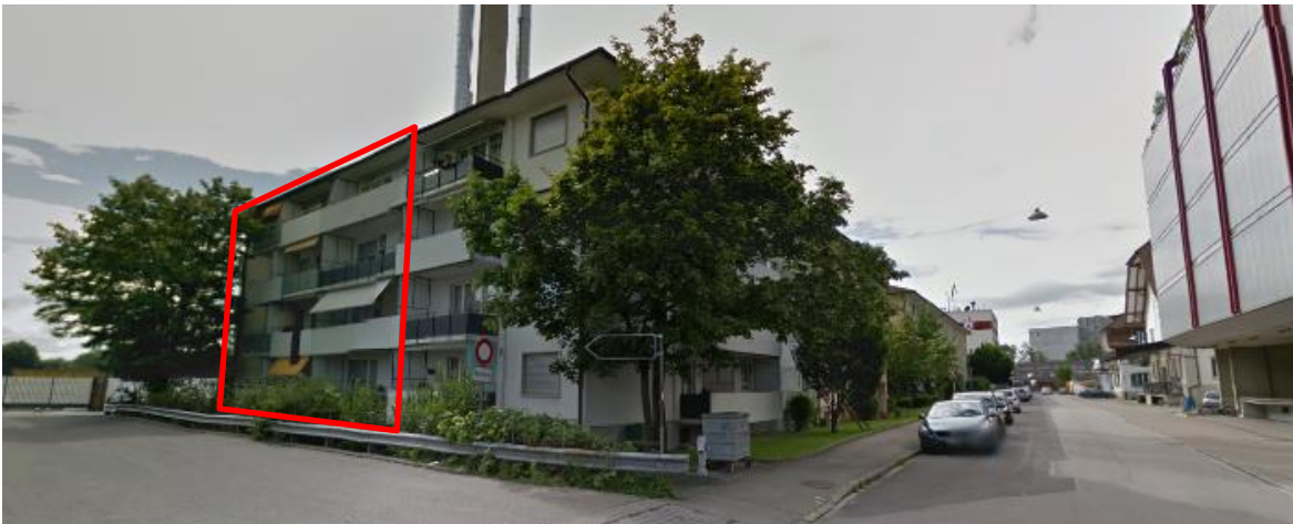
Wohngebäude Güterstrasse 20

Das Mehrfamilienhaus Güterstrasse 20 umfasst auf vier Wohngeschossen acht 3,5-Zimmerwohnungen. Der Zugangsbereich und die Gemeinschaftsräume wie Wasch- und Trockenraum, der Technikraum sowie die Kellerabteile befinden sich im Erdgeschoss.