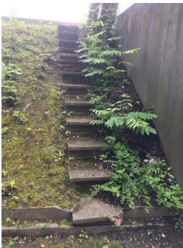
Zustand der Umgebung