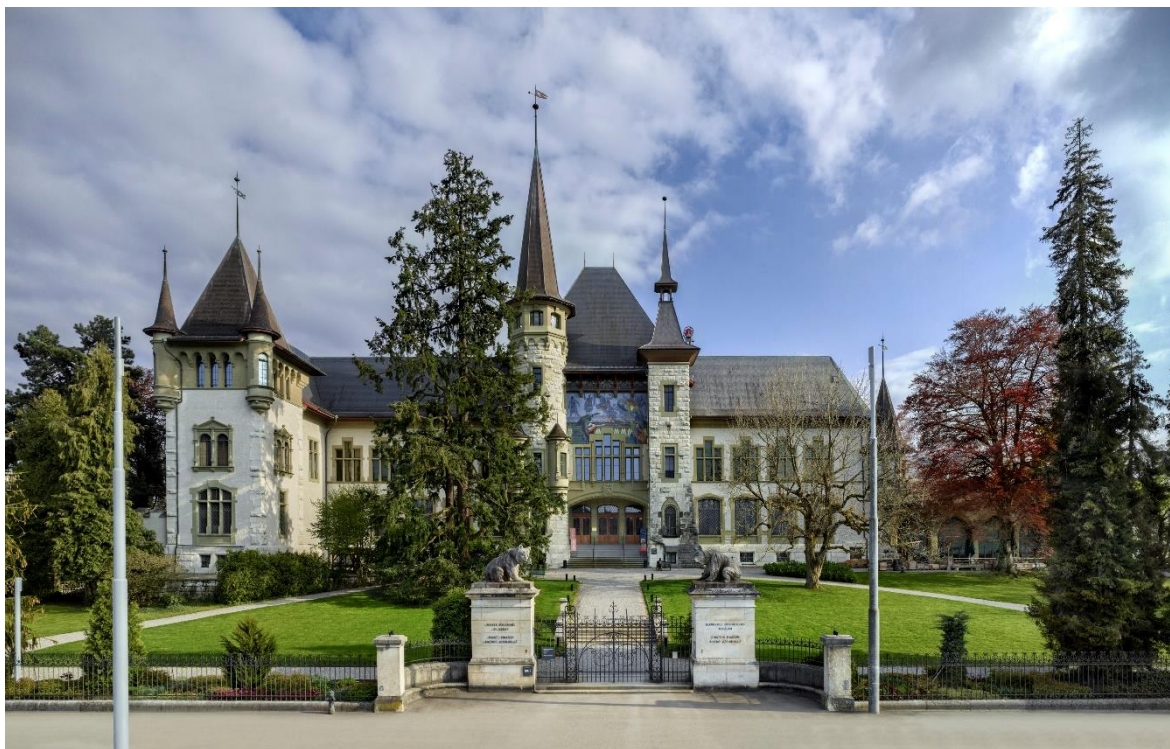
Bernisches Historisches Museum, Haupteingang Seite Helvetiaplatz

Darüber hinaus hat der Gemeinderat in der Mittelfristigen Investitionsplanung (MIP) verteilt über die Jahre 2023 bis 2028 den Betrag von insgesamt 25 Mio. Franken eingestellt. Das entspricht einer ersten Schätzung der Kosten für die Sanierung des Altbaus für die Stadt Bern. Die Beträge werden angepasst, sobald sich das Projekt weiter konkretisiert.