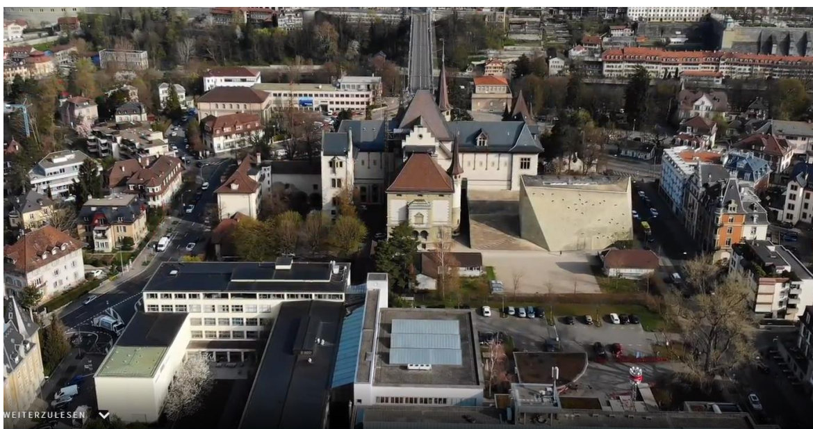
Vogelperspektive von Süden Richtung Kirchenfeldbrücke

Die Vertreter von Kanton Bern, Stadt Bern und Burgergemeinde Bern, Stifter*innen und Finanzierungsträger*innen des BHM, haben eine gemeinsame Einschätzung der Eingabe und ein Konsens zum weiteren Vorgehen erarbeitet. Sie teilten dem BHM mit, dass sie den grossen und dringenden Sanierungsbedarf des Altbaus des Bernischen Historischen Museums anerkennen. Die Anfrage des BHM käme jedoch für die Aufnahme in den Voranschlag 2022 zu spät, die effektive Kreditbewilligung liege in der Kompetenz der jeweils zuständigen Organe und bedinge eine längere Vorlaufzeit. Zudem müssten vorgängig die Anforderungen der vom Stiftungsrat des BHM im Juli 2021 überarbeiteten Museumsstrategie an eine Sanierung des Altbaus geklärt werden. Hierzu müsse eine Nutzungsstudie erarbeitet werden. Danach müsse mit einer Machbarkeitsstudie und einem nachgelagerten Studienauftrag die Grundlagen für die Projektierung aktualisiert werden. Zudem wiesen die Finanzierungsträger und Stifter*innen darauf hin, dass bei der Sanierung des Altbaus eine Anbindung an das Museumsquartier berücksichtigt und die Fläche hinter dem BHM aufgewertet werden müsse.