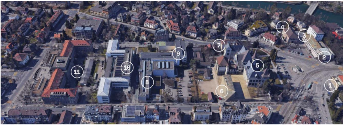
Übersicht der beteiligten Institutionen des Museumsquartier Bern: