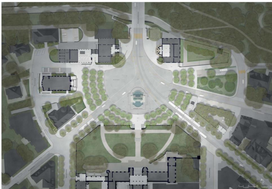
Städtebaulicher Wettbewerb Helvetiaplatz, Siegerprojekt «coquilles saint-jacques», exträ Landschaftsarchitekten Bern

An seiner Sitzung vom 4. November 2020 hat der Gemeinderat beschlossen, das Projekt Umgestaltung Helvetiaplatz unter der Federführung des Tiefbauamts der Stadt Bern bis auf weiteres zu sistieren und die Entwicklung des Museumsquartiers abzuwarten. Es ist vorgesehen, sämtliche Sanierungsmassnahmen auf dem Areal BHM so zu projektieren und umzusetzen, dass diese einer späteren Realisierung des juriierten Wettbewerbsprojekts Helvetiaplatz nicht widersprechen.