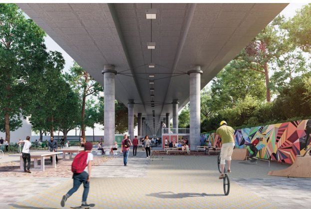
Unter dem nördlichen Teil des Autobahnviadukts der A12 ist ein öffentlicher Freiraum für verschiedene Nutzungen geplant. (Visualisierung: Tend AG)

Im nördlichen Bereich Richtung Murtenstrasse soll der Freiraum für Nutzungen zur Verfügung stehen, die durch den Strassenlärm weniger beeinträchtigt werden, beispielsweise für Ballsportarten oder Skateboarding. Südlich davon