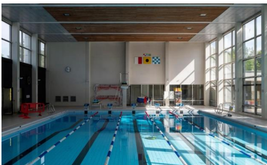
Abb. 5: Hallenbad Innen