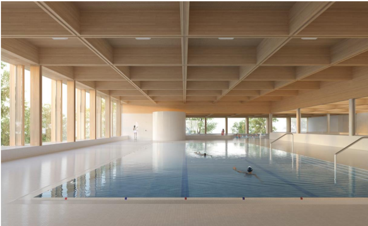
Abb. 10: Visualisierung Lehrschwimmbecken - Kinderplanschbereich im Hintergrund

Auf dem Niveau des Untergeschosses befinden sich die beiden Eisfelder. Die Eishalle und das Auseneisfeld sind durch die Garderoben für die Eishockeyspieler*innen und die Eiskunstläufer*innen voneinander getrennt. Im nördlichen Bereich des Untergeschosses befinden sich Technik- und Betriebsräume, im Süden ist die Betriebsgarage verortet. Der Ausbaustandard ist der Nutzung entsprechend einfach und robust gehalten. Entlang der Korridore finden sich im Untergeschoss mehr als 360 mietbare Garderobenkästen. Die zahlreichen Mietkästen sollen die Vereinsmitglieder dazu bewegen, die Anlage mit dem öffentlichen Verkehr oder dem Velo aufzusuchen.