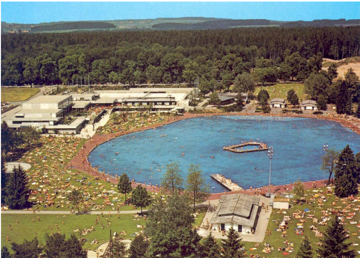
Abb. 1: Luftbild Weyermannshaus 1971

Die Architekten Friedli und Sulzer erweiterten das Freibad 1971 zur heutigen Sport- und Freizeitanlage mit einem Hallenbad und einer offenen Kunsteisbahn. Die Siebzigerjahre Bauten und die dazugehörige Eisanlage besetzen den Nordwesten der Parzelle entlang der Ecke Stöckackerstrasse und alte Murtenstrasse. Die Gebäude der Sport- und Freizeitanlage wurden als Betonelementbau realisiert, das Hallenbad ist typengleich wie dasjenige im Wylerbad. Im Jahr 2011 wurde der Garderoben- und Eingangstrakt des Hallenbads umgebaut und saniert.