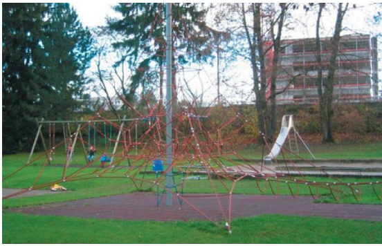
Abb. 7: Spielplatz