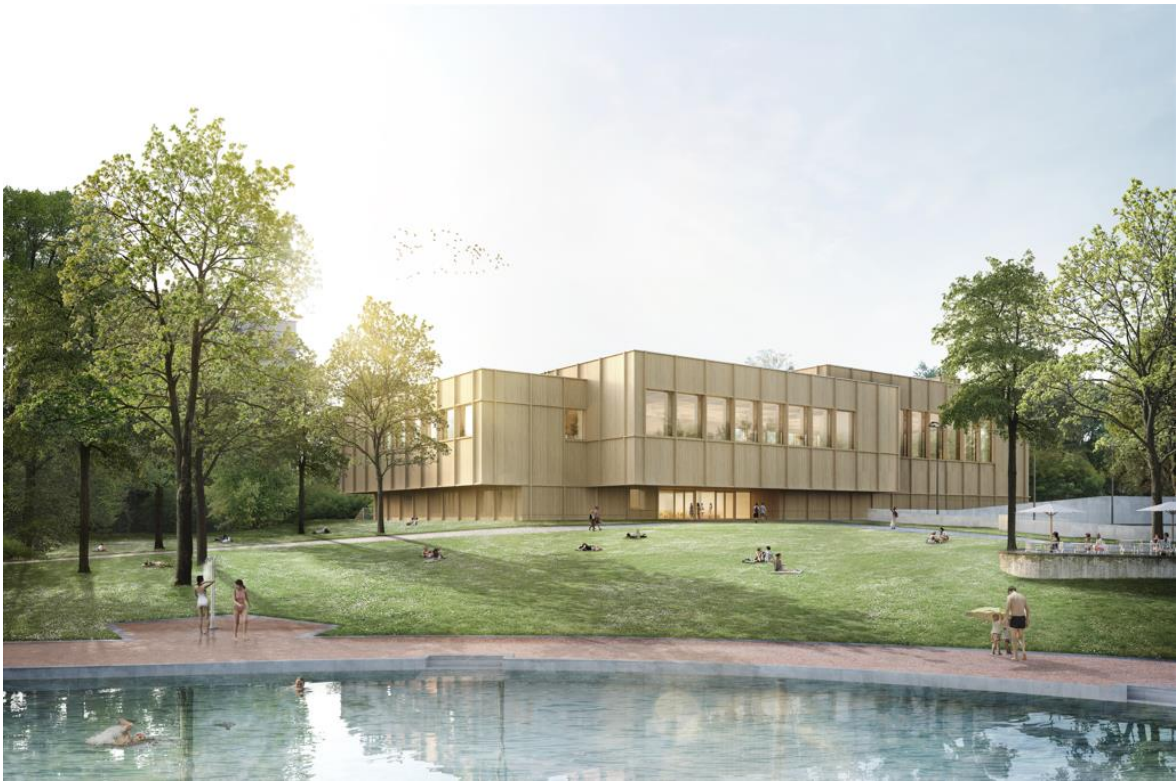
Abb. 9: Visualisierung des Neubaus

Das Gebäude ist aus allen Richtungen zugänglich. Der überdeckte Haupteingang ist zum Parkinnern ausgerichtet und befindet sich zwischen dem Neubau und dem Ausseneisfeld. Auf der Westseite ist auf dem Niveau der Stöckackerstrasse ein Gebäudezugang für den Betrieb und die Vereinsmitglieder der Eishockeyvereine vorgesehen. Besucher*innen betreten das Gebäude über eine Empfangshalle mit einem verglasten Atrium und Blickbezug in die Eishalle. Seitlich an das Atrium angegliedert ist eine prägnante Treppe, darüber gelangen die Besucher*innen entweder in das Hallenbad im Obergeschoss oder in den Eisbereich im Untergeschoss.