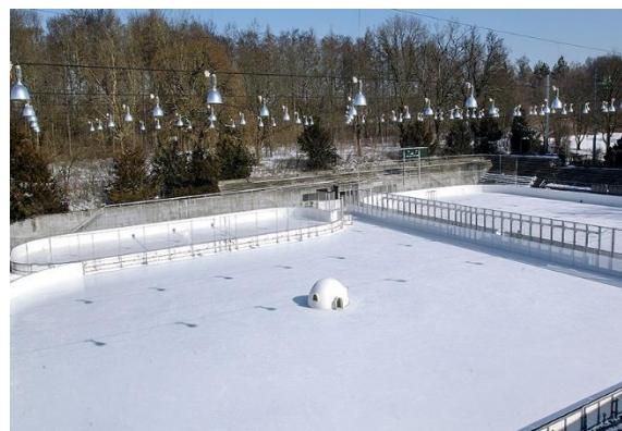
Abb. 4: Eisbahn