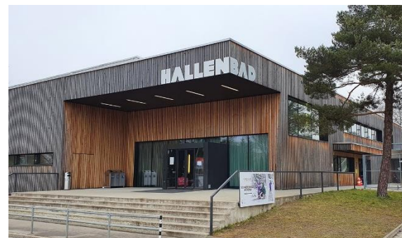
Abb. 6: Zugang Hallenbad