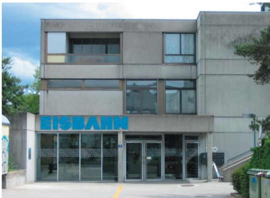
Abb. 3: Zugang Eisbahn

Aus heutiger Sicht ist der Flächenkonsum des bestehenden Gebäudekomplexes sowie die Anzahl der Garderoben im Freibad zu hoch. Der Bedarf nach zusätzlichen Liegeflächen wird aufgrund der diversen Projektentwicklungen im Umfeld künftig nochmals stark zunehmen. Der Spielplatz im südlichen Bereich des Freibads muss komplett erneuert werden.