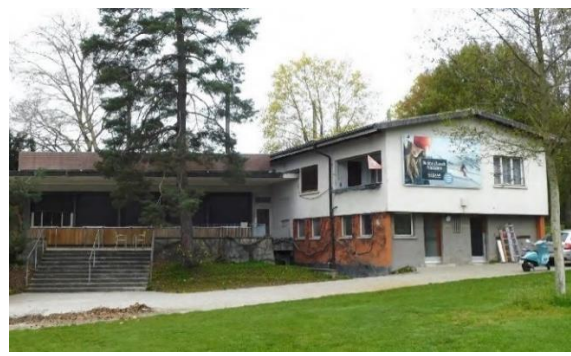
Abb. 8: Pavillongebäude