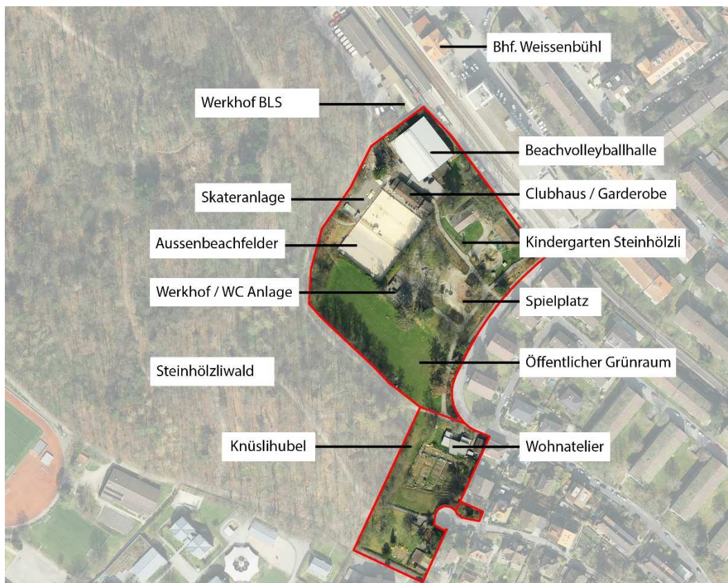
Luftbild: Städtische Parzellen GBBi.-Nr. 920/III Goumoënsmatte und GBBi.-Nr. 2856/III Knüslhubel

termonaten bestehen Engpässe, ein Ausbau der Kapazität ist aus Sicht des Beachcenters anzustreben. Die heutige Sportnutzung ist allerdings nicht zonenkonform. Das unselbständige Baurecht und die befristete Baubewilligung für die vom Beachcenter Bern im 2009 erstellte Halle laufen im Jahr 2020 aus. Für die Weiterführung der heutigen Nutzungen ist somit eine Anpassung des Zonenplans mit Volksabstimmung notwendig. Für die Zeit bis zur Volksabstimmung ist eine Verlängerung der Ausnahmegewilligung einzuholen.