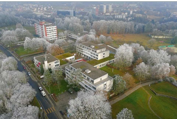
Luftaufnahme des Areals Reichenbachstrasse 118 von Südosten her: Die Gebäude im Vordergrund dienten bis 2011 als Standort der ehemaligen Krankenpflegeschule Engeried und werden heute verschiedentlich zwischengenutzt. Im Hintergrund ist ein Gebäude des benachbarten Wohnheims Rossfeld zu sehen.

Seit Jahren ist der Wohnungsbau ein Schwerpunkt der Politik in der Stadt Bern und wird auch in Zukunft eine grosse Bedeutung haben. Es herrscht nach wie vor Wohnraumknappheit, wobei insbesondere wenig günstiger Wohnraum und wenige Familienwohnungen vorhanden sind. Zudem bleibt die Nachfrage aufgrund des Bevölkerungswachstums voraussichtlich hoch. Gemäss den Zielen der städtischen Wohnstrategie will die Stadt künftig vermehrt selbst bauen. Zudem soll für alle Bewohnerinnen und Bewohner der Stadt Bern, insbesondere auch für Familien und auf dem Wohnungsmarkt benachteiligt-