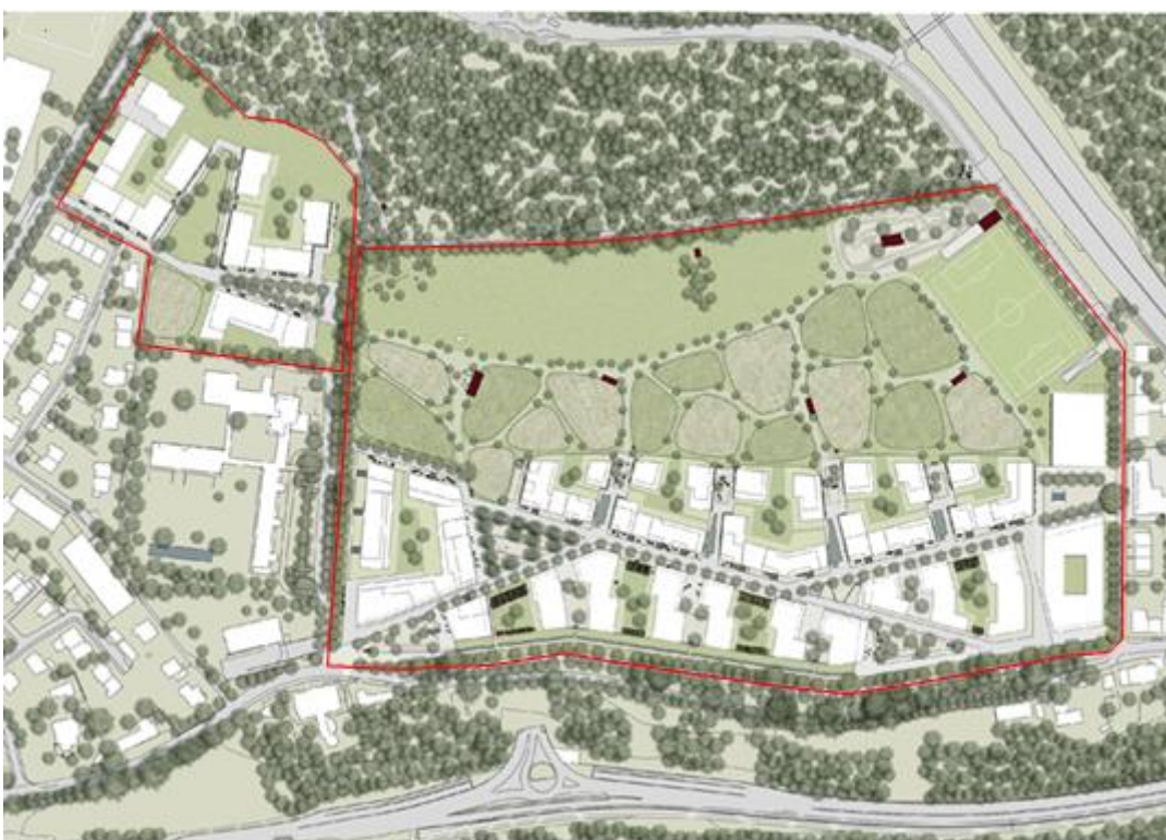
Städtebauliches Konzept Vierfeld / Mittelfeld gemäss Masterplan, Mai 2020, Planungssperimeter: rot

Die Masterplanung erfolgte gestützt auf die Ergebnisse des städtebaulichen Wettbewerbs und die Empfehlungen des Preisgerichts unter Federführung der Stadt und des Siegerteams «Städtebau» zusammen mit den beauftragten Teams der Projektteile «Wohnen». In einem ersten Schritt wurden die verschiedenen Lösungsvorschläge der Wohnideen auf das siegreiche städtebauliche Konzept abgestimmt. Im weiteren Verlauf wurden die verschiedenen Bauetappen definiert, die Nutzungen und Infrastrukturmassnahmen konkretisiert sowie die Baurechtsgrundstücke festgelegt. Der Prozess wurde von Vertreterinnen und Vertretern der Wettbewerbsjury begleitet.